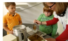
TEE MACHEN SCHLOSS-APOTHEKE SCHMALKALDEN