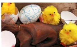
OSTER-BASTELEI NUR EINE VON VIELEN