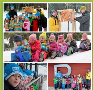
Von Verein und Eltern organisierter Draussentag mit Schmalkalder Olympiasiegern