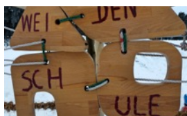
PATENSCHAFTSBAUM TOLLES SCHILD VON KLASSE 2 UND 3